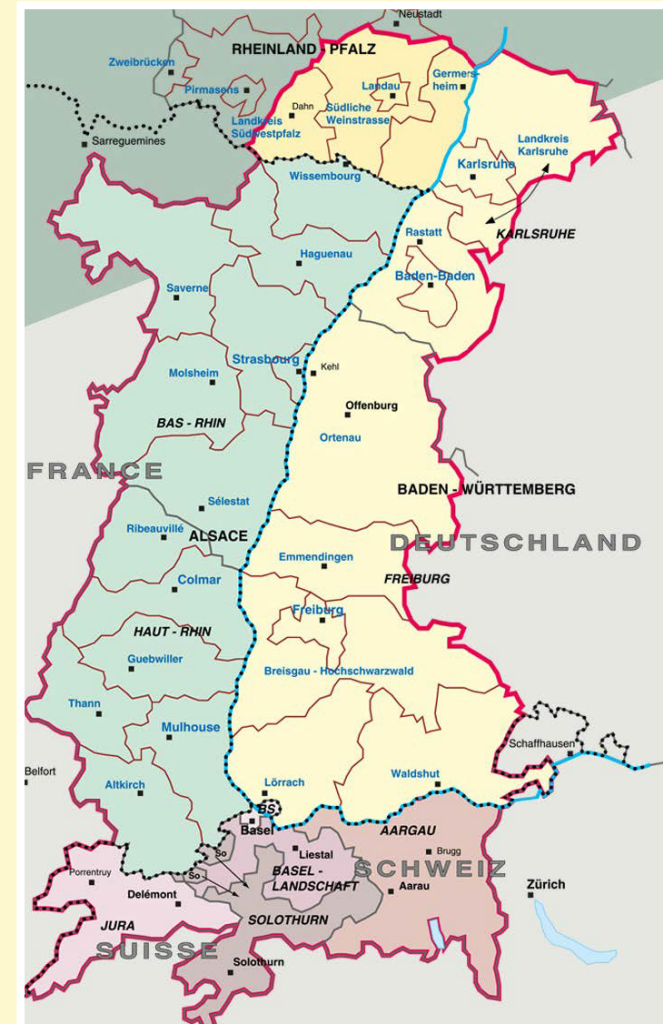
Mandatsgebiete der Oberrheinkonferenz